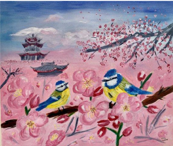
Ume Park Pergoda 梅林の塔