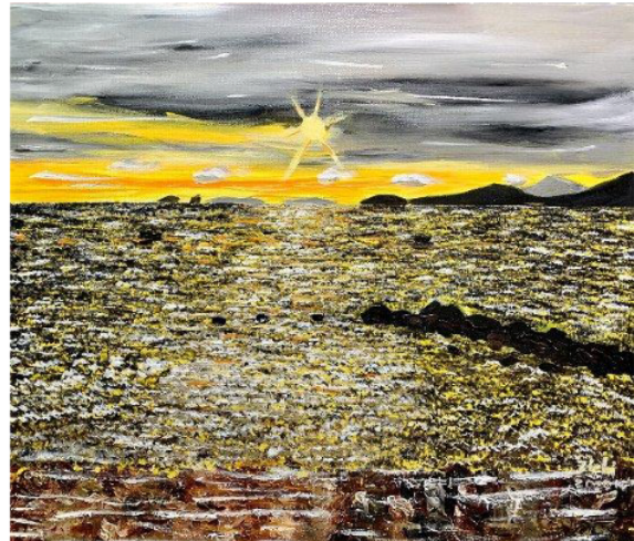
Golden Shinmaiko ゴールデン新舞子