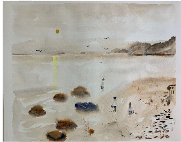
Collecting Shell Fish 貝を集める